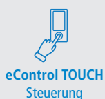
eControl TOUCH Steuerung