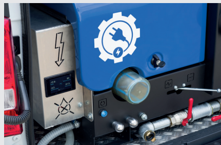
mit 30 kWh (6x5) Leistung für ca. 1 Stunde Dauerbetrieb