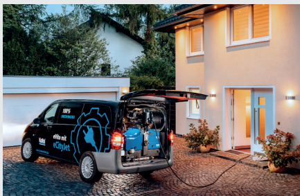
Elektrische, um 180° schwenkbare Hochdruck-Haspel