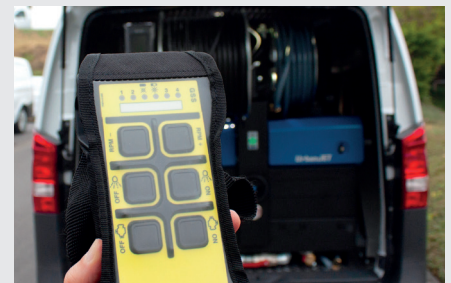
Funkfernbedienung Riomote 7-Kanal (optional)

Änderungen und Irrtümer vorbehalten, Stand 25.11.2022