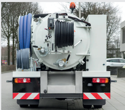
Heckansicht mit Saughaspel, Hochdruck- und Wasserzufuhrhaspel