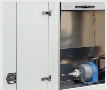
Beidseitige Staukästen für weitere Maschinen und Zubehör

Änderungen und Irrtümer vorbehalten, Stand 21.12.2022