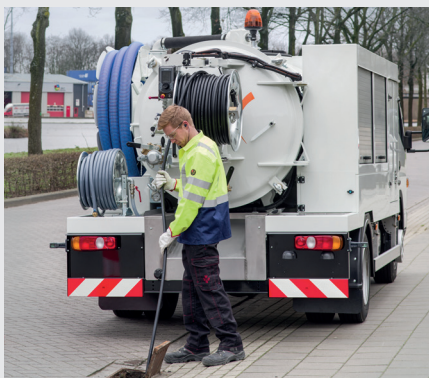
RioCom im Einsatz (HD-Spülen)