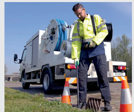
bequeme Steuerung über serienmäßige Fernbedienung

Änderungen und Irrtümer vorbehalten, Stand 21.12.2022