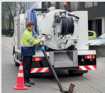
RioCom im Einsatz (Absaugen)